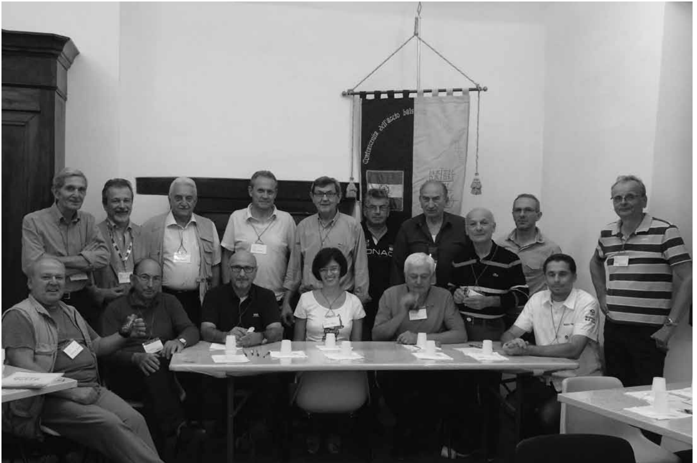
Una parte degli assaggiatori nella sede di Scandiano.