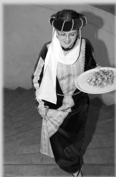
Dame e cavalieri in costume alla presentazione dei piatti.