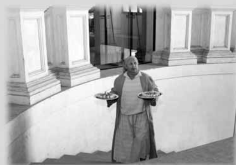
Un cameriere speciale sullo scalone d'onore.